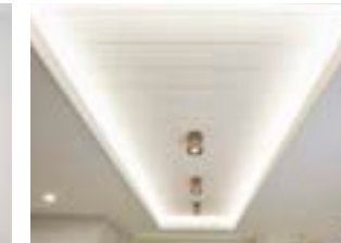
주방 우물천장 및 간접조명