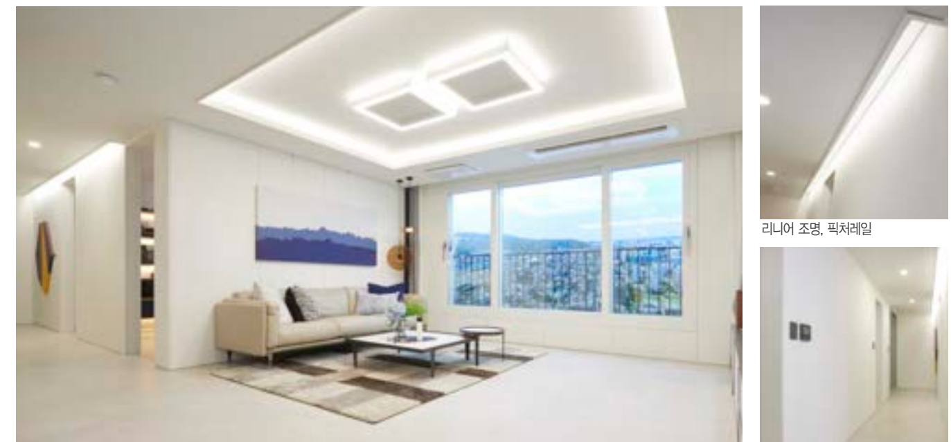
거실 우물천장 내 간접조명, 리니어 조명, 픽처레일, 시트패널