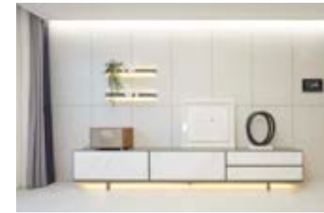
유럽산 대형 포셀린타일